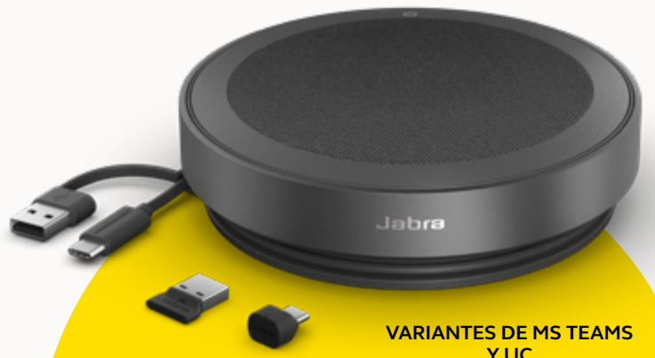
VARIANTES DE MS TEAMS Y UC

Para proteger nuestro planeta, tenemos presente la sostenibilidad cuidadosamente en cada etapa del desarrollo de un producto. La carcasa del Speak2 75 se elabora con más de 33% de materiales sostenibles 3 , con una serie de piezas integradas que se pueden reparar o reemplazar. Mejor sostenibilidad = mayor vida útil del altavoz = llamadas de gran calidad para usted y su equipo durante muchos años.