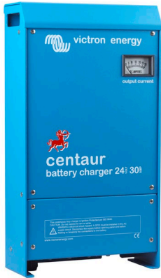
Centaur Battery Charger 24 30i