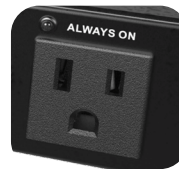
Tomas de Corriente IEC Disponibles