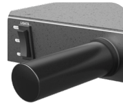
Tubos de Iluminación LED Retráctiles