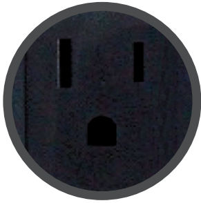
8 Tomas de salida. [4 con AVR - Supresión de picos 4 solo con supresión]

El nuevo y avanzado Regulador de Voltaje Automático R2C, el más completo y de mejor calidad. Este nuevo producto ofrece 8 tomas de salidas, corrige bajas y altas tensiones y proporciona un regulado de 120 o 220 VCA dependiendo el modelo. La pantalla LED oculta, indica energía y voltajes de entrada anormales. La protección Coaxial, varía dependiendo el modelo seleccionado.