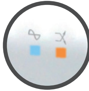
Pantalla LED oculta.